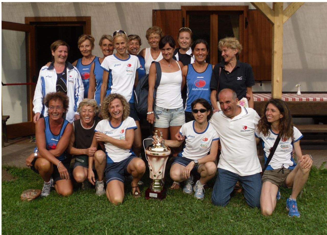
La squadra delle "Signore della Corsa" fresche di titolo italiano.